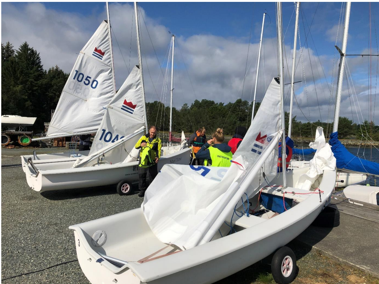
Fra kurs i jolleseiling